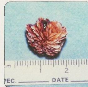
Oxalaatstenen, afbeelding van ruwe uitstekende delen