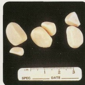
Meerdere, gladde struvietstenen